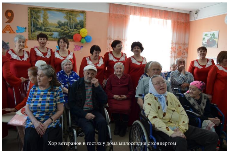
Хор ветеранов в гостях у дома милосердия с концертом

Тесный творческий контакт военкомата, отдела ЗАГС и РДК позволил сделать традиционными такие мероприятия как «Проводы в армию», «Обряд бракосочетания», «Обряд имянаречения», «100 ребенок», «Семейные традиции».