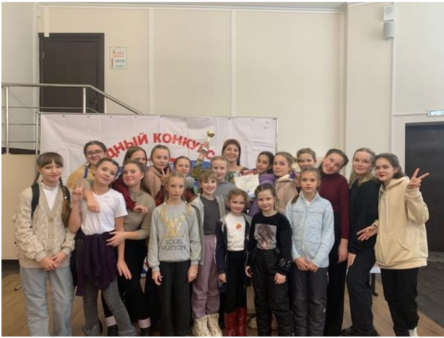
Участники кружка декоративно-прикладного творчества «Волшебная кисть» и «Чудесная мастерская ДК «Юбилейный»