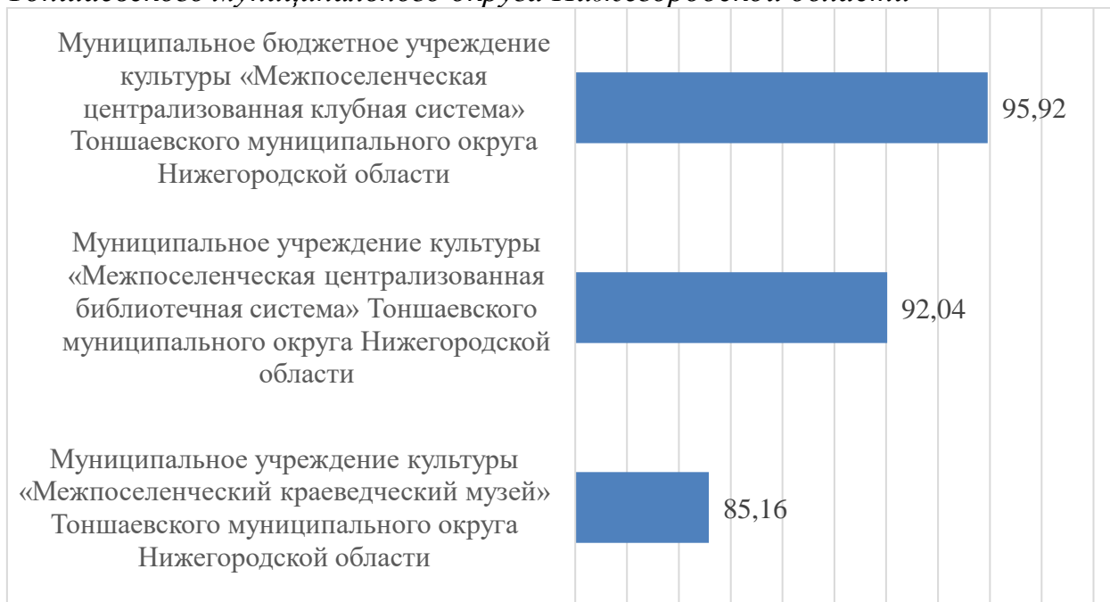
Гистограмма 1. Рейтинг по результатам сбора, обобщения и анализа информации о качестве условий оказания услуг организациями культуры Тоншаевского муниципального округа Нижегородской области